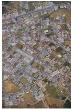
写真2 現代の沖縄の住宅地

写真1は、沖縄の備瀬という伝統的な集落です。ここでは、ここに暮らす住民が協力し合って街全体の環境を整えてきた様子が察せられます。それぞれの敷地の四方に、フクギという樹木が植えられた家々が基盤の目のように並び、その緑が延々と連なって森のような環境が形成されてきたのです。どうして、こうした環境が生まれるのかというと、それは、その当時の建物を造る工法が木造しかなかったからです。木造では、大きな台風襲来時壊れてしまうので、台風の通り道であるこの地域にとっては、自分たちの家を守るために、防風林として建物の周囲に樹木を植えることが必須だったのです。そして、一軒一軒の樹木をつなげあうことで、風に対して強い集落全体の構造を形成してきたのです。さらに、この環境は、耕作地を塩害から守る役割も併せ持っています。さらに、夏には、大量の樹木が空調装置として機能し、涼しさをもたらします。このように、周囲の環境づくりは、ここに暮らす人々にとって、なくてはならない重要なものでした。そして、こうした環境を育成していくために、村人の関係性はお