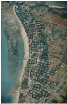
写真1 沖縄・備瀬の集落

食事の話だけでなく、こうしたことは、あらゆる場面で進んでいきます。たとえば、写真1と写真2とを比較すると、街の構造も同じように大きく変容することがわかります。