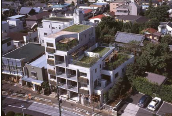
写真3 樫ハウスの全景

配置されました。そして、中庭と住まいとの間には、大きな樫を囲んで湾曲させた共用廊下があり、更にこの共用廊下と各住まいとの間には、格子戸で囲まれプライバシーの守られたテラスが配置されました。