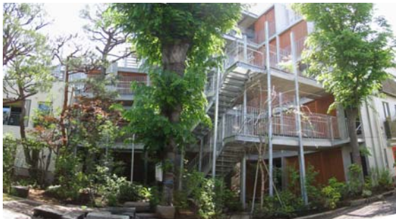
写真4 樫ハウスの中庭

こうして、外環境を空調装置として位置づけ、その環境を室内へと「領域」を「統合」することにつなげるということが、「樫ハウス」で追求された計画コンセプトでした。