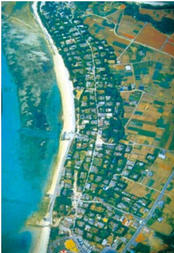
写真1 沖縄・備瀬の集落

たとえば、沖縄の本部半島に備瀬という集落を航空写真(写真1)で見ると、なんと美しいカタ