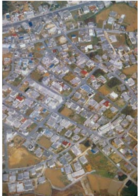
写真2 現代の沖縄の住宅地